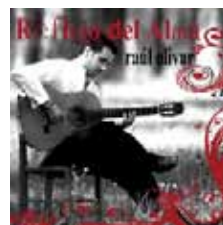
Reflejo del alma