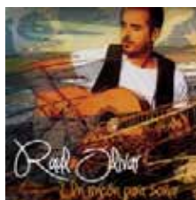
Un rincón para soñar 2013